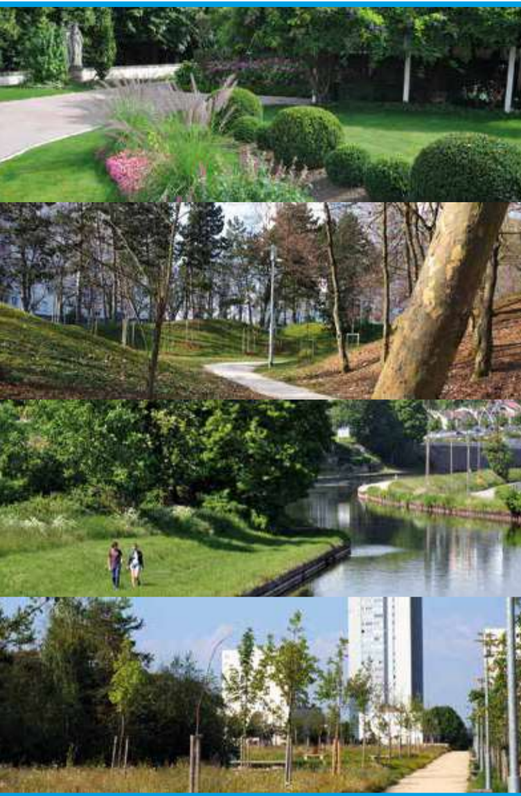
PLAN DE VILLE